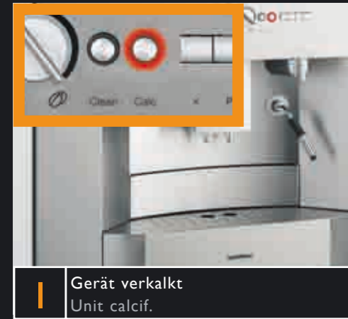
1 Gerät verkalkt Unit calcif.