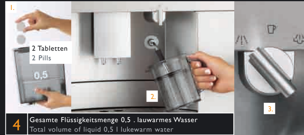
4 Gesamte Flüssigkeitsmenge 0,5 l lauwarmes Wasser Total volume of liquid 0,5 l lukewarm water