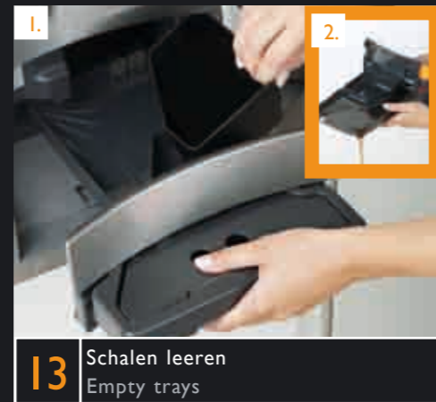
13 Schalen leeren Empty trays