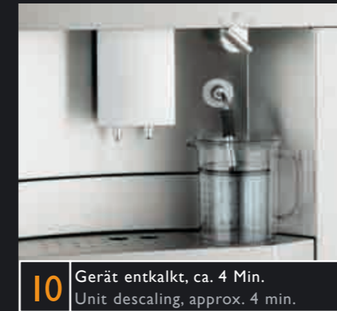
10 Gerät entkalkt, ca. 4 Min. Unit descaling, approx. 4 min.