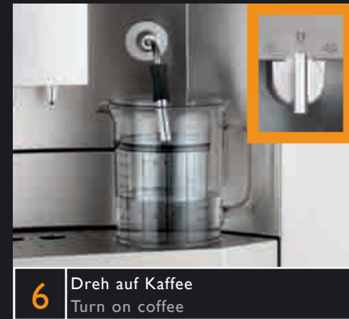
6 Dreh auf Kaffee Turn on coffee