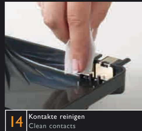
14 Kontakte reinigen Clean contacts