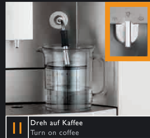
11 Dreh auf Kaffee Turn on coffee