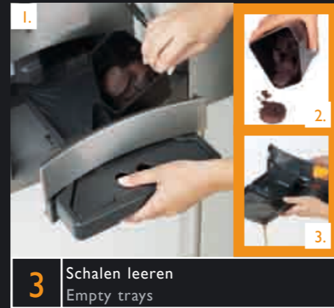
3 Schalen leeren Empty trays