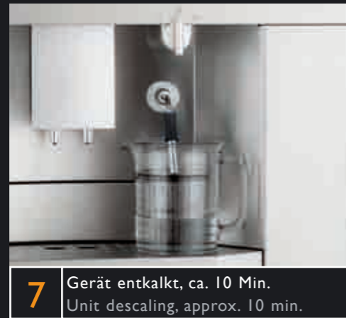
7 Gerät entkalkt, ca. 10 Min. Unit descaling, approx. 10 min.