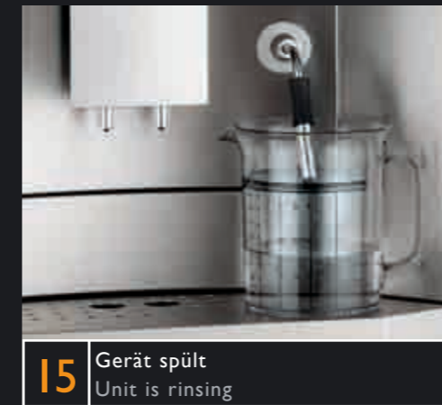
15 Gerät spült Unit is rinsing