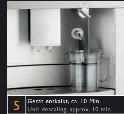
5 Gerät entkalkt, ca. 10 Min. Unit descaling, approx. 10 min.