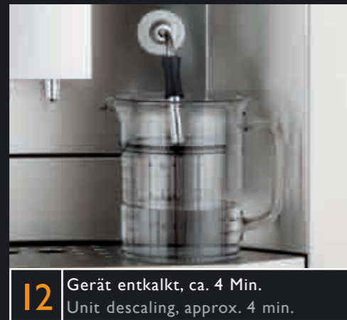
12 Gerät entkalkt, ca. 4 Min. Unit descaling, approx. 4 min.