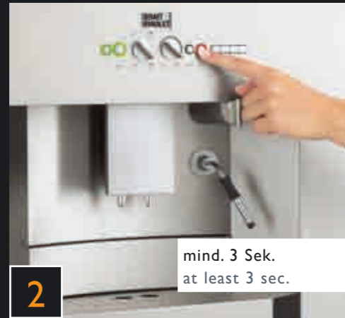
2 mind. 3 Sek. at least 3 sec.