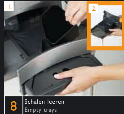
8 Schalen leeren Empty trays